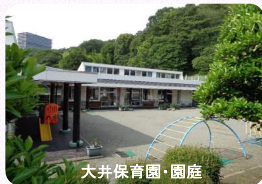
大井保育園・園庭