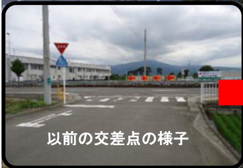
以前の交差点の様子